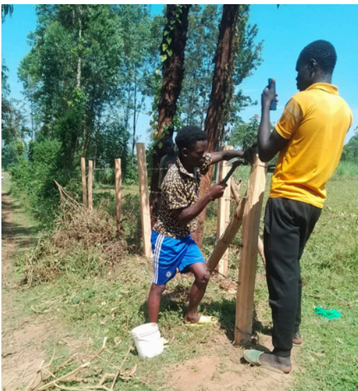
Deze omheining was helemaal ingestort. Zij is gerenoveerd en weer in haar oorspronkelijke staat hersteld.

Een goede oogst betekent ook meer om op de markt te verkopen, meer omzet en in staat zijn een financiële reserve op te bouwen. Niet alleen om de magere jaren te kunnen opvangen, maar vooral ook om door samenredzaamheid en coöperatief denken de verdere scholing van de jeugd - in het bijzonder van meisjes - te kunnen bekostigen. Maar voorlopig is daarvoor onze steun nog hard nodig. (^HvdB)