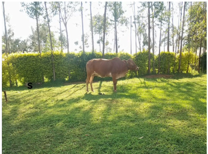
Op zaterdagmiddag, bedaad in de wei... ↗ Droge struiken werden verzameld en verbrand om striga de kop in te drukken.